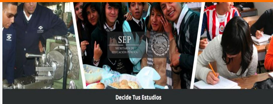
Decide Tus Estudios

(3.2 TCUTVDE: Tasa de crecimiento del uso de los test vocacionales del portal Decide tus Estudios)